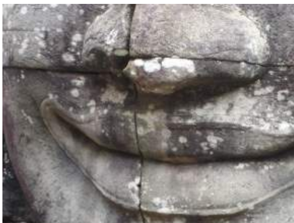
La joie intérieure (Angkor)

« Mes Maîtres ne m'ont pas seulement enseigné des techniques. Ils m'ont aidé à comprendre ce qui se trouve au-delà des techniques et de l'art : la Vie. Ils m'ont montré une Voie : celle de la communication avec tous les vivants, celle de l'intégration consciente dans cet immense élan de joie qu'est la Voie de la Vie... »